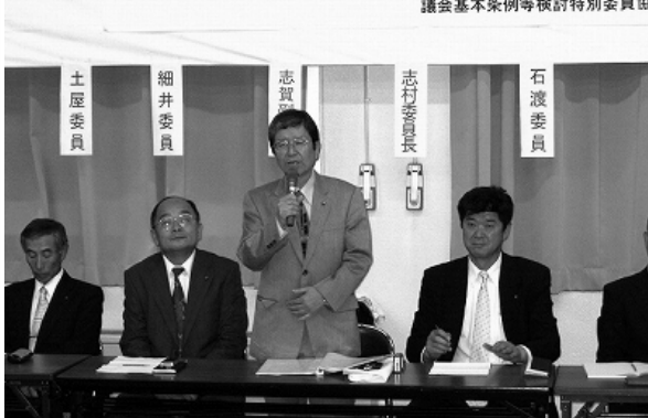
昨年4月13日、タワービル4階会議室で

り本格的に稼働し始めた。同年4月13日、三島本町タワービル、三島市民活動センター会議室で、「議会と市民の何でもトーク」が開催された。