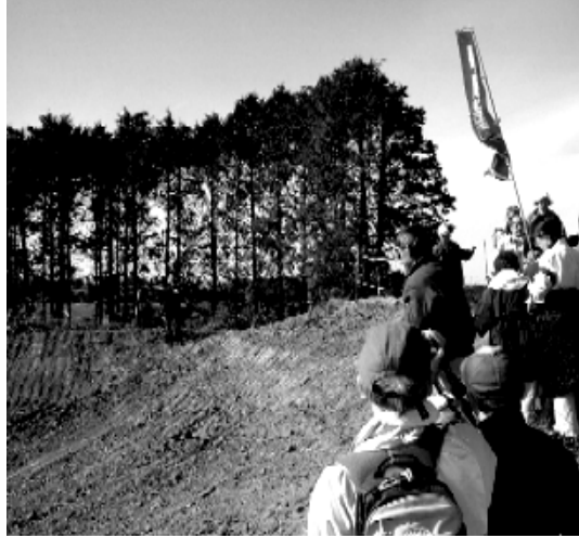
2008年11月24日空港現地見学

今年度予算のうち、空港関連は、本体整備費約72億円のほかに、観光キャンペーン、広報宣伝、旅客ターミナルビル整備資金の貸付を主とする「就航促進事業費」約38億6千万円が含まれる。