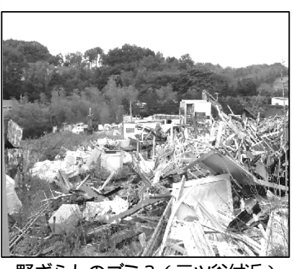
野ざらしのゴミ?(三ツ谷付近)

投票日、朝から雨が降り続き、午後遅く、雨が上がったものの、気温は平年より低く、薄ら寒い一日だったが、天候の不順も低投票率の一因だったかも知れない。しかし、低投票率の原因は、若者が投票に行かないというのが大きな問題のようだ。近年よりは足を引きずってでも投票所に向かうが、若者の姿は余り見かけなかったというのが、多くの人の感想である。