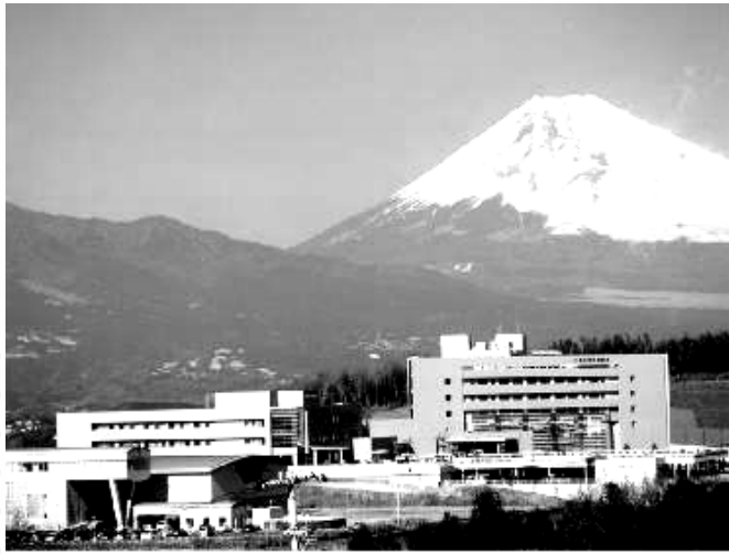
三島社会保険病院全景

社会保険庁の廃止に伴い、その受け皿として、今年10月、公法人である全国健康保険協会が設立される。その結果、九月三日をもって各地の社会保険病院等は、設置基盤を失うため、当面、独立行政法人の年金・健康保険福祉施設整理機構に移管されることとなった。元々「整理機構」は二〇〇五年十月、五年の期限で全国年金福祉施設等の整理・売却が目的でつくられた団体である。この後、二年までの間に、三島社会保険病院の処遇はどのようなものか、病院関係者に話を聞いてみた。