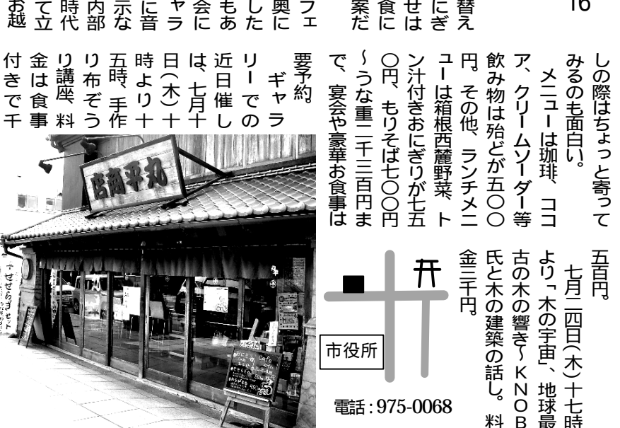
おにぎりカフェ丸平 市役所 電話：975-0068

シリーズ 街中の喫茶店(6) 中央町4 16 三島大社の西側交差点、北西角から三軒目にちよつと古風な二階建瓦葺の店がある。一見したところ呉服屋のようなたたずまい。実はこの店は「おにぎりカフェ丸平」といい、れっきとした喫茶店だ。江戸時代末期から代々金物屋として続いていたが、五年前現在の店に変わった。 今、この店を営んでいるのは、店長である河村結里子さんという若女主人。彼女のお婆さんが金物屋をたたんだため、内部を改装して現在の「おにぎりカフェ」に衣替えをしたとのこと。おにぎりと珈琲の組み合わせは異色だが、日本的な食文化にこだわる女主人の発案だそう。 お店はおにぎりカフェだけでなく、敷地の奥には土蔵の内部を改造したギャラリーや蕎麦処もあり、ちよつとした宴会にも使える。土蔵のギャラリーでは毎月のように音楽イベントや美術展示などが催されている。内部の柱や梁はいかにも時代を偲ばせ、黒光りして立派なものだ。近くにお越