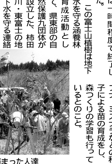
4/29 富士山植樹で集まった人達

この富士山植樹は地下水を守る涵養林育成活動として、県東部の自然保護九団体が設立した、柿田川・東富士の地下水を守る連絡会が中心となり一九九七年以来行われている活動である。