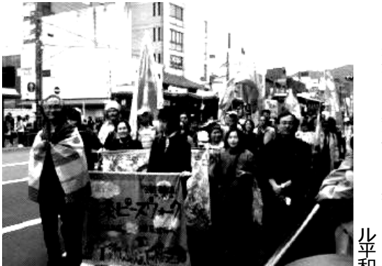
四月十八日は沼津から三島・日大まで行進。日大で午後四時から交流会。地元の人々に行進や交流会への参加を呼び掛ける。

地域全体の集団安全保証の土台となってきた(紛争予防国連会議(GPPP AC、二〇〇五年)「各国政府は、日本の9条のよりに、憲法により戦争を放棄すべきである(パンクバー世界平和フォーラム二〇〇六年)など、しかし、その一方で、昨年の改憲国民投票法案の強行採決に見られるように、改憲の動きも強ま