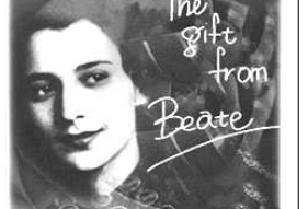
憲法14条「法の下での平等」と24条「家庭生活における両性の平等」を草案したベアテ・シロタ・ゴードン

ひろば新聞定期購読者募集 申し込みは上記連絡先へ 毎月3000部発行 年額10000円