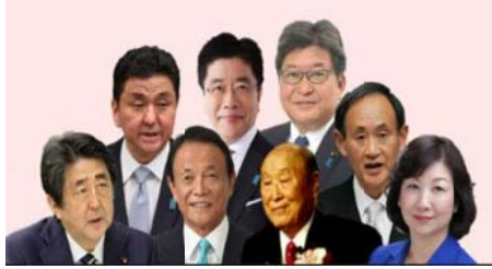
統一教会と深い関係の自民党大物議員

昨年7月8日、演説中の安倍首相が凶弾に倒れ世界に激震が走った。その後、事件をめぐって封印されていた安倍・自民党と統一教会の間の世界が大きく口を開き、国民の知らなかった癒着問題がマスコミを通してさらけ出された。安倍晋三の祖父、岸信介の時代から統一教会の元祖文鮮明との深いつながりが表面化し、驚くべき問題が明らかとなった。 恐るべき統一教会の野望 世界平和統一家庭連合(旧統一協会)と自民党の起点は、敗戦後、A級戦犯であったが復権し、1957年に総理大臣に就任した岸信介にある。これまで安倍家3代に渡り深い関係を保ち、統一教会は、64年宗教法として認定され、68年には「国際勝共連合」を設立、岸信介や竹下登、等と共に活動を進めてきた。「勝共連合」の主張は、「自主憲法制定とスパイ防止法成立」をあげ、当時の自民党の主張と符合する。岸の死後、その関係は娘婿、安倍晋太郎に引き継がれ、文鮮明は晋太郎に期待を寄せた。87年、晋太郎は、竹下登、宮澤喜一と3人で総裁選を争うが、竹下政権が誕生することになった。その時敗れた晋太郎について、文鮮明は「日本はとんでもない間違いを