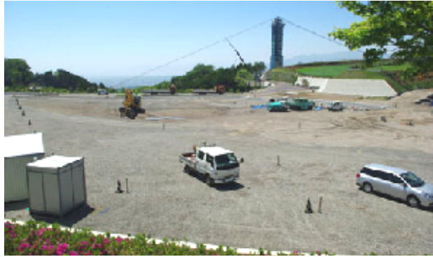
つり橋遺構と駐車場予定地 5月13日撮影

箱根西麓の標高350m以上の場所の大部分は江戸時代から入会地(いりあいち)で草地、里山として周辺住民が共同利用してきた場所である。現在、その管理は「一部事務組合」という行政組織が行っている。三島市外五ヶ市町箱根山組合、三島市外三ヶ市町箱根山林組合と呼ばれる組織がそれである。その運営は構成自治体の住民の代表によってなされている。