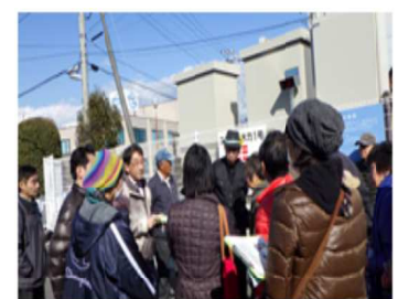
水車を含めた発電装置耐用年数は20年余で、売電を10年

ニコニコ水力1号は道路沿いにある用水路で川幅2メートル半のところに設定されている。普通の家庭10軒分ほどの電気をまかなえる。羽は地域の木材を使い、加工組み立ても地元でできた。民間企業主体でつたので地元の要望どおり1年程度でできた。売電利益の一部は水利組合や地元へ還元している。自動的の上下される。水車の前にはゴミ取り格子があつてゴミがある量たまつたら自動的にゴミを格子の下に押し下げて流し、水車を保護する。