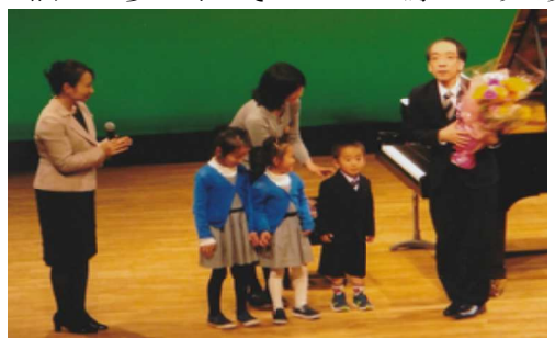
中でも珠玉は「富士山」

原発に反対でない人々の顔も紹介することで、より合理的に考えられる。原発を容認していたが原発は絶対ダメと理解できた。再稼働は九条改憲路線と同時進歩だと思つた。政権は国民をなめきつてい。なめられない国民にならなければ。首相が世界に向けて放った嘘を告発できないのか。オリンピックの費用を福